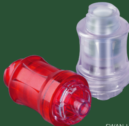
SWAN-LOCK® / SWAN-LOCK® RED

SWAN-LOCK® RED mit transparentem roten Gehäuse zur Farbcodierung, z.B. für die arterielle Zugangskontrolle.